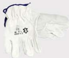
42070100000 Guante conductor con goma de ajuste Driver glove with upper elastic