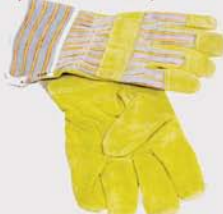
42070500003 Guante americano con forro Full lined Rigger type glove