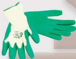
4207030xx02 Guante látex con dorso de algodón y puño elástico Latex glove with cotton shell and elastic wrist