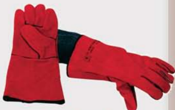
4207060000 Guante de soldador serraje rojo forrado Welding gauntlet, split leather, fully lined