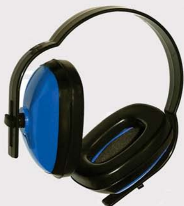
Cascos insonorizadores Ear muffs C € EN 352 43PC344AZ