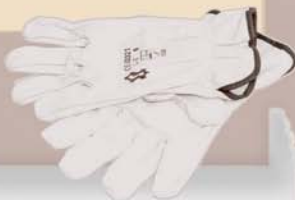
4207000xx00 Guante piel de vaca con goma y ribete Cow glove with upper elastic