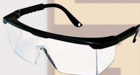
Lente policarbonato Polycarbonate lenses C € EN 1661.F 43PGD490NC