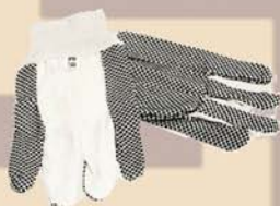
42070200000 Guante tela con puño elástico y puntos en PVC negros Cotton drill with a PVC polka dot palm and knitted wrist