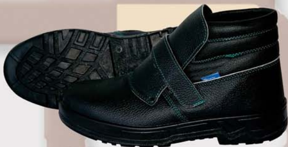
FORCE S1P Tallas: 38/48