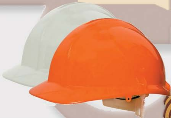
Cascos de seguridad Safety helmet Regulación de tamaño por cinta C € EN 397 43PC439BL (BLANCO / White) 43PC439NJ (NARANJA / Orange)