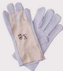
43GC527xx Guante adaptable dorso algodón Working glove