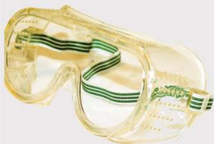
Lente policarbonato Polycarbonate lenses C € EN 166-1B 43PGB4C