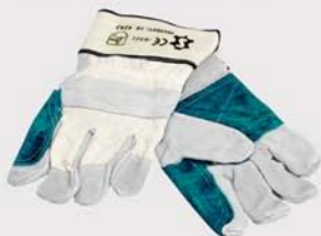
42070400002 Guante americano con refuerzo verde Rigger type glove