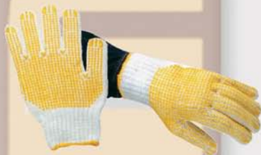
42071100001 Guante de punto en poliester/algodón con puntos de PVC Knitted mixed fibre glove, polyester/cotton, with yellow PVC dots