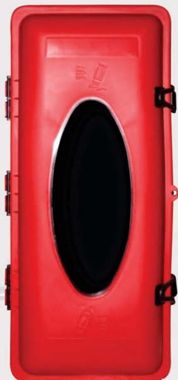
Cajón porta extintor Fire extinguisher holder