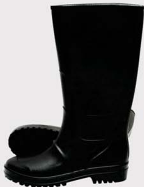
4206060xx05 Bota de PVC caña alta Rubber boot Tallas / Sizes: 38/46