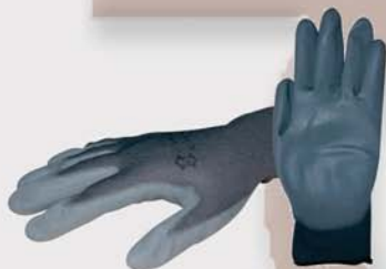
42071000000 Guante nylon recubierto de poliuretano gris con puño elástico Nylon glove coated with PU with knit wrist