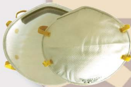
Mascarillas de protección. Pack 20 und. Dust mask C € EN 149 43PM4821